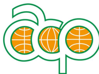
Implementado pelo Secretariado ACP