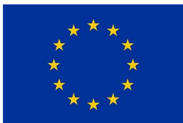
Cofundado pela União Europeia

O Programa Tradecom II contribui para o desenvolvimento económico sustentável e para a redução da pobreza nos países ACP, através de uma integração regional mais estreita e de uma maior participação na economia mundial.